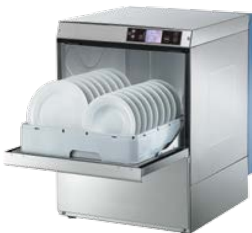
GAM 540E GAM 560E