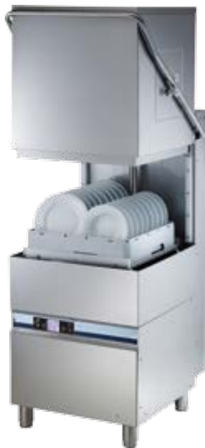
GAM 1100TRE GAM 1200TRE

hood dishwashers lave-vaisselle a hotte lavajillas de capota